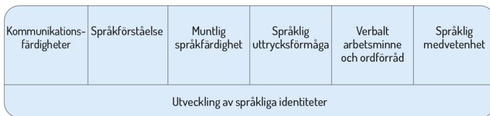
Figur 2. Språkutvecklingens centrala delområden inom småbarnspedagogiken

Med tanke på utvecklingen av kommunikationsfärdigheter är det viktigt att barnen upplever att de blir hörda och att deras initiativ blir bemötta. Det är centralt att personalen är sensitiv för och reagerar även på barnens non-verbala budskap. Utvecklingen av kommunikationsfärdigheter stöds genom att barnen uppmuntras att kommunicera med personalen och med varandra.