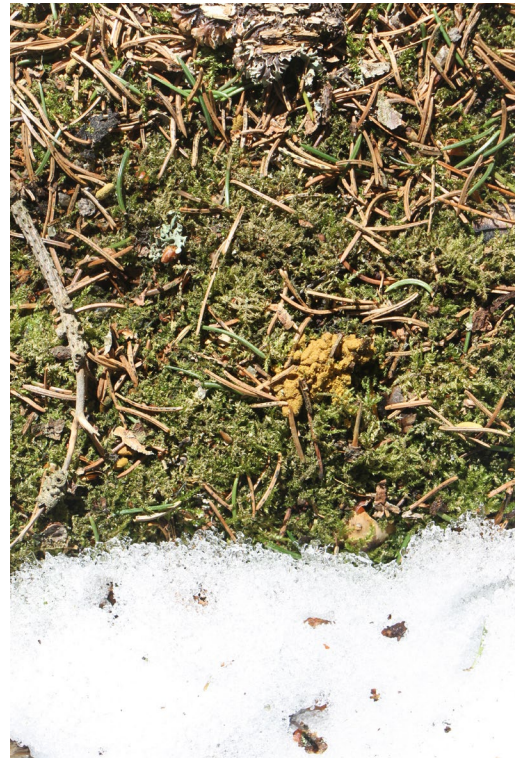
Liito-oravan jo hieman hajonnut jätöskasa