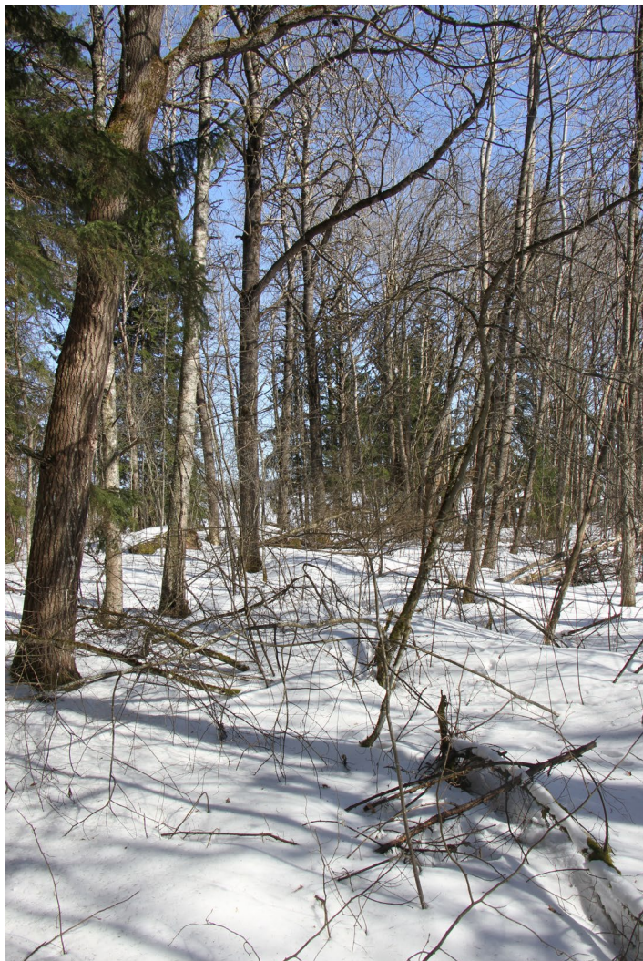
Liito-oravan ruokailualueen pohjoisreunassa

Koska liito-oravan lisääntymis- ja levähdyspaikkoja ei saa hävittää tai heikentää on elinpiiri rajattava hakkuiden ulkopuolelle. Toisaalta laki metsätuhoista edellyttää maanomistajalta toimenpiteitä kuoriaistuhojen estämiseksi ja nämä kaksi asiaa ovat tällä kohteella ristiriidassa toistensa kanssa. Valvovana viranomaisena paikallinen Ely-keskus tekee tarvittaessa liito-oravan elinpiirin rajauspäätöksen tai myöntää poikkeusluvan hakkuihin mikäli lajin suojelutaso säilyy suotuisana.