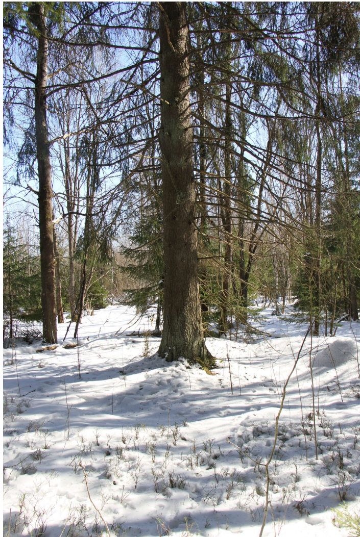
Liito-oravan käyttämä suojapuu, jonka alta löytyi eniten lajin jätöksiä