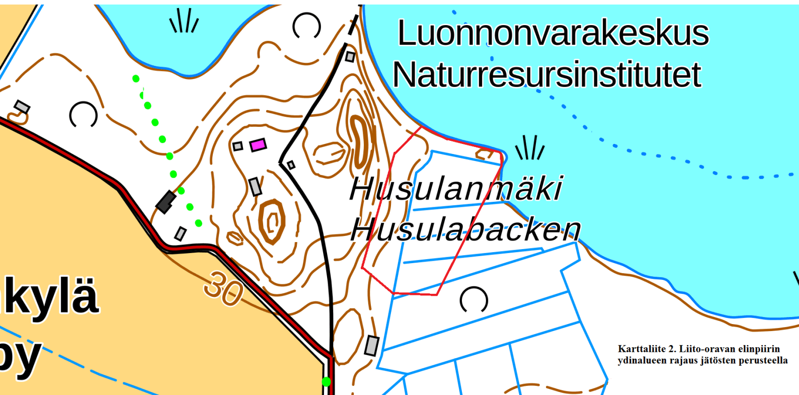
Karttaliite 2. Liito-oravan elinpiirin ydinalueen rajaus jätösten perusteella