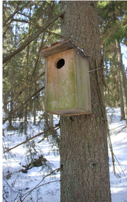
Alueelle on ripustettu muutamia liito-oravalle sopivia pönttöjä