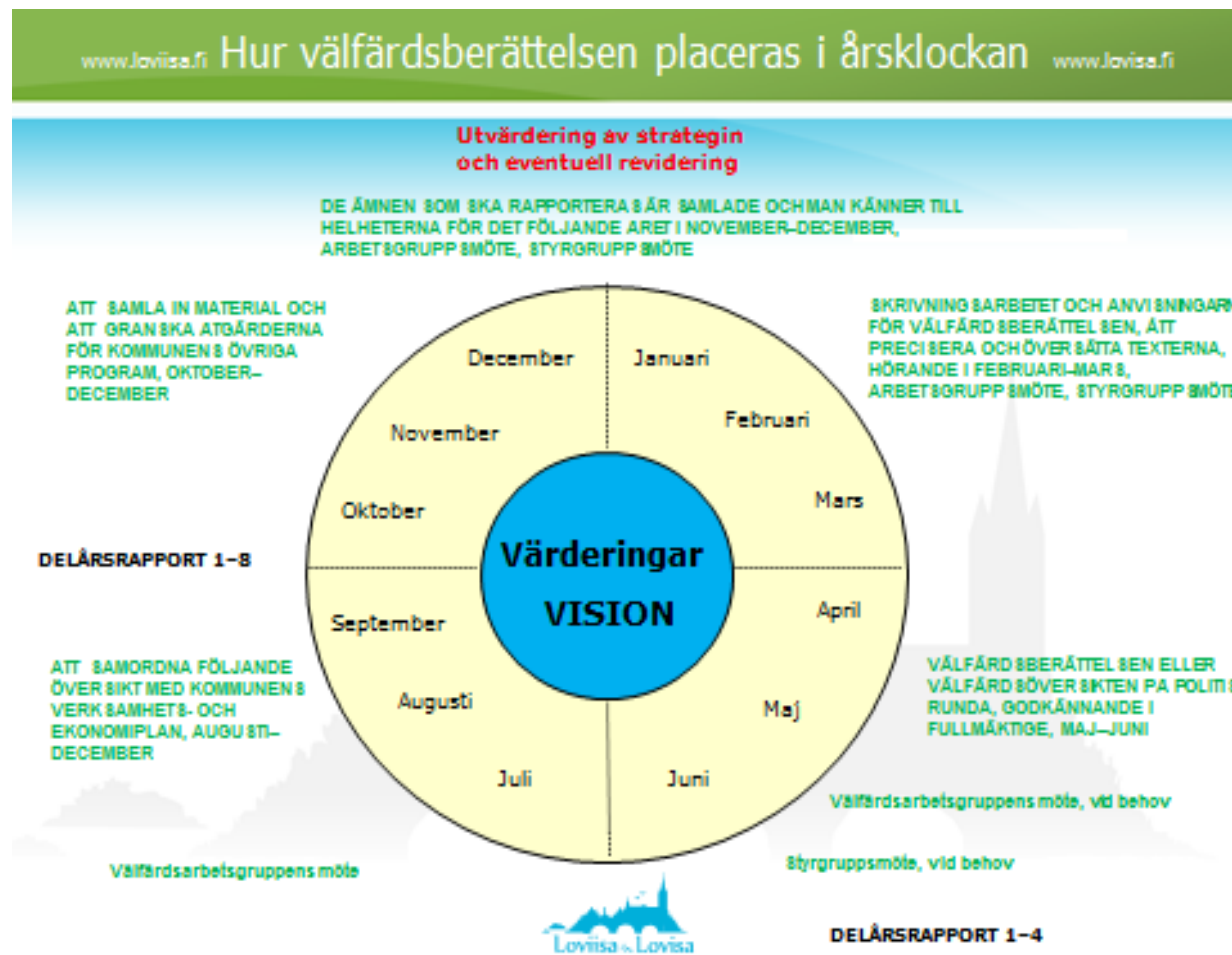
Figur2. Årsklocka för välfärdsplaneringen