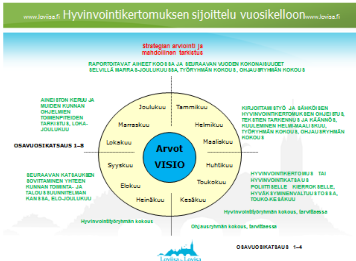
Kuvio 2. Hyvinvointisuunnittelun vuosikello